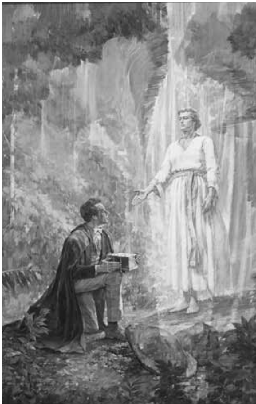
Joseph Smith recebeu as placas de ouro de Morôni em 22 de setembro de 1827. O Profeta testificou: "Recebi as placas juntamente com o Urim e o Tumim, por meio dos quais as traduzi; e assim surgiu o Livro de Mórmon".