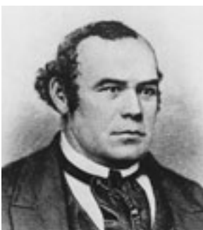
Parley P. Pratt

Parley P. Pratt, membro del Quorum dei Dodici Apostoli dal 1835 al 1857: «Il presidente Joseph Smith era alto di statura, robusto, forte e attivo; aveva la carnagione chiara, i capelli biondi, gli occhi azzurri, poca barba e un'espressione del tutto unica... Il suo aspetto era calmo, affabile; mostrava di essere intelligente e buono di cuore; la sua espressione era un insieme di interessamento, sorriso, allegria, libera da ogni affettazione o gravità. Nel suo sguardo c'era qualcosa di sereno e penetrante, come se fosse in grado di vedere negli abissi più profondi dell'animo umano, scrutare l'eternità, penetrare nei cieli e comprendere tutti i mondi.